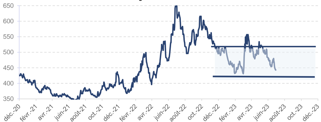
Graphe 2 : Evolution des primes de risque High Yield (Indice Global)

Après un resserrement spectaculaire en début d'année de l'ordre de -84 pbs (passant de 515 pbs au 01/01/2023 à 431 pbs au 30/06/2023), les spreads de marché High Yield Global (HW00) se sont fortement écartés (d'environ +126 pbs) à 557 pbs en mars et avril 2023 avec la faillite de 4 banques régionales américaines et l'épisode Crédit Suisse pour s'établir actuellement à 457 pbs (données arrêtées au 30/06/2023).