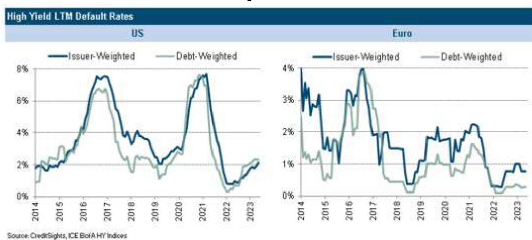
Graphe 3 : Evolution des Taux de défaut High Yield (aux États-Unis et en Europe)

A fin juin 2023, sur 12 mois glissants, les taux de défaut restent en dessous de 1% en Europe et franchissent à peine le seuil de 2% aux États-Unis. Pour le High Yield US, les taux de défaut sont en ligne avec nos prévisions. En revanche, ils sont en dessous en Europe et restent sur des niveaux historiquement bas.