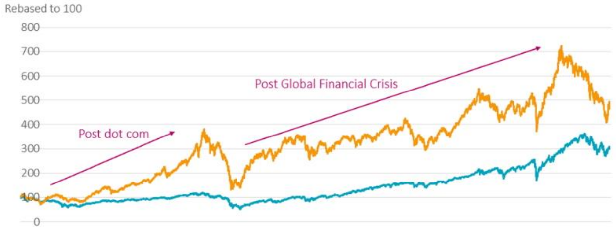
Graphique 1 : Comparaison de l'évolution du cours des actions entre l'indice MSCI Asia Ex Japan et le S&P 500

Source : Source : MSCI, Bloomberg. Période couverte par les données : décembre 2000 à décembre 2022.