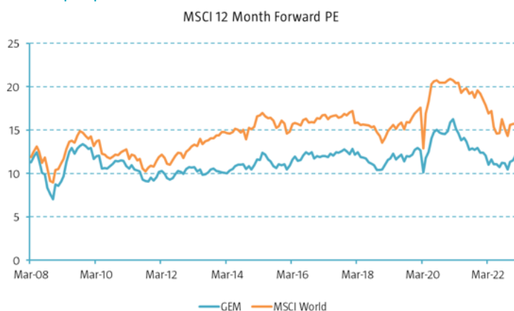
Graphique 2 – Écart de valorisation entre les MD et les ME

En outre, les indicateurs de valorisation ont atteint des niveaux extrêmes en 2022, les ME se négociant à une décote de 30 % par rapport aux MD. Cet écart s'est légèrement réduit, mais reste injustifié à nos yeux.